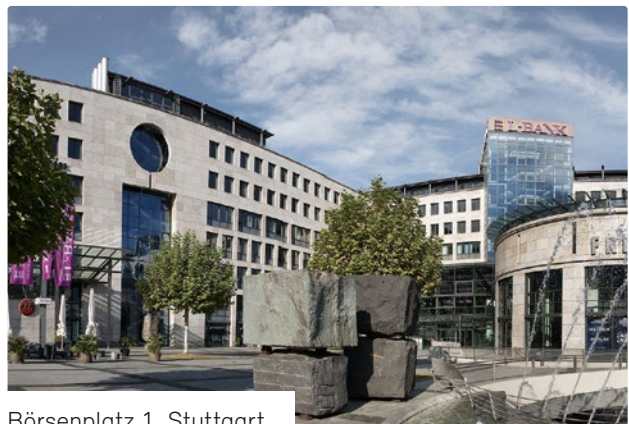
Börsenplatz 1, Stuttgart