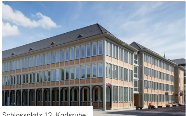
Schlossplatz 12, Karlsruhe