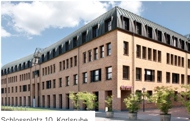
Schlossplatz 10, Karlsruhe

Mit diesem Bericht dokumentieren wir unsere Nachhaltigkeitsarbeit. Der Bericht folgt dem Wesentlichkeitsgrundsatz. Er enthält alle Informationen, die für das Verständnis der Nachhaltigkeitssituation unseres Unternehmens erforderlich sind und die wichtigen wirtschaftlichen, ökologischen und gesellschaftlichen Auswirkungen unseres Unternehmens widerspiegeln.